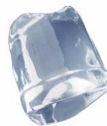
18 gr FULL ICE CUBE